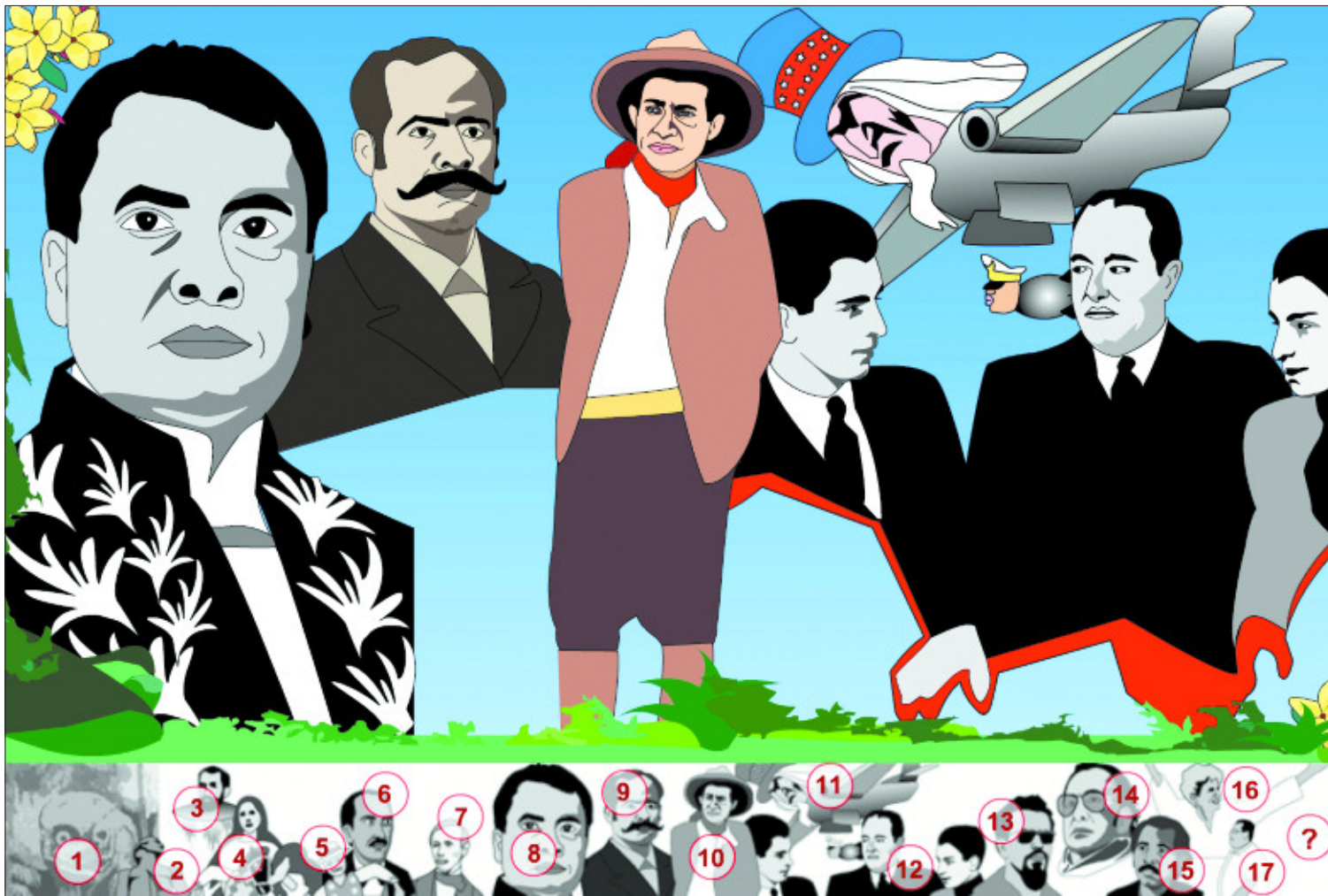
El muralismo llega a Internet con Fallout .